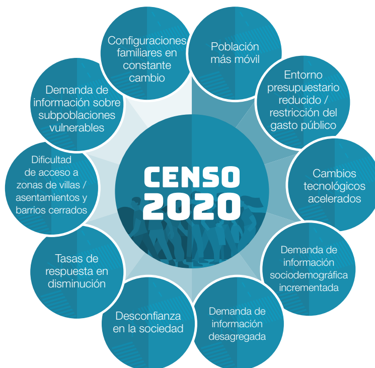
Figura 1. El Censo de la ronda 2020 y sus desafíos