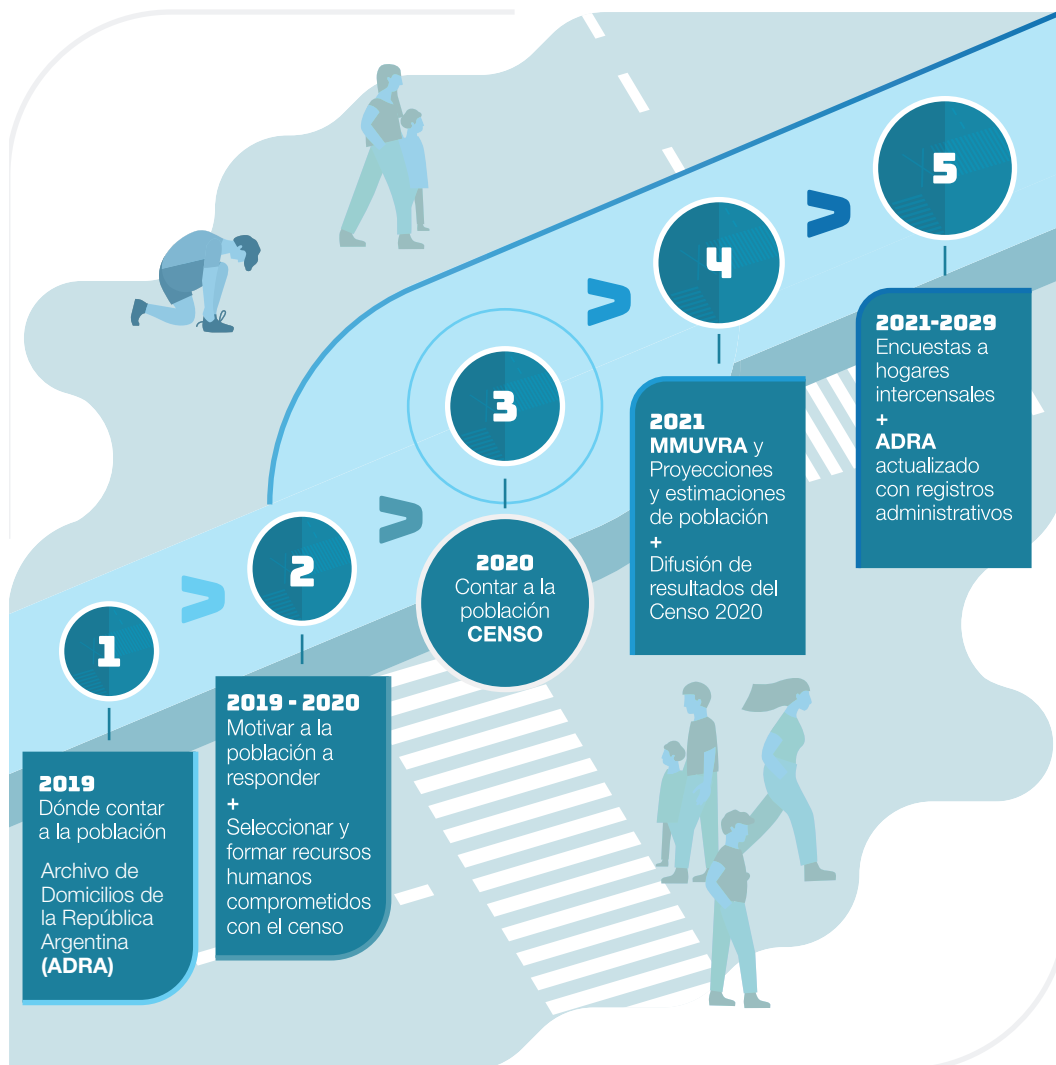
Figura 2. Censo de la ronda 2020