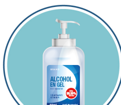
ALCOHOL EN GEL