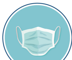
TAPABOCAS (NARIZ, BOCA Y MENTÓN)