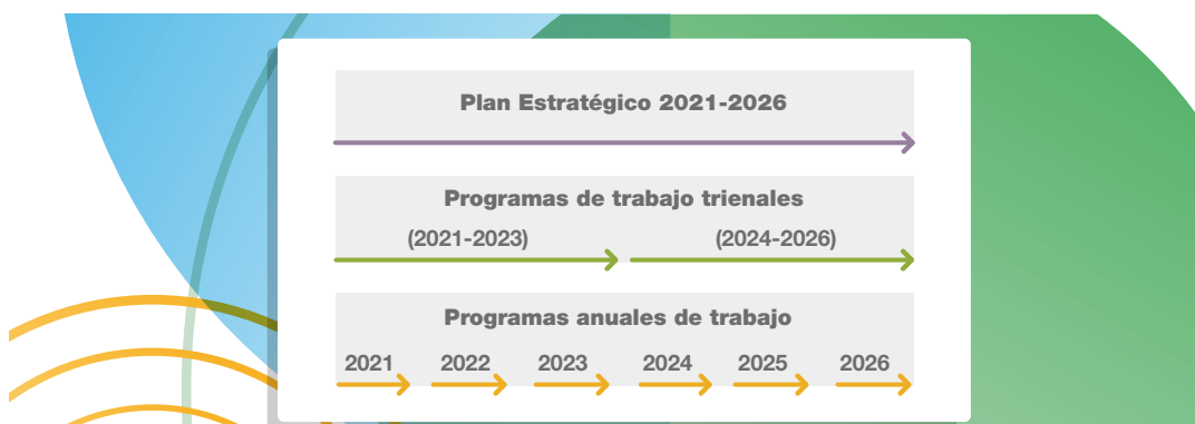
Gráfico 1. Ciclo de planificación estratégica en el ámbito del INDEC

De este modo, la materialización e implementación de los objetivos estratégicos en proyectos, actividades y tareas se realizan mediante la ejecución de programas de trabajo tanto trienales como anuales. Una vez que el INDEC define, promueve y monitorea las perspectivas estratégicas del Instituto, estas se traducen en objetivos, proyectos y actividades continuas a nivel de cada una de las áreas que componen la estructura organizativa actualmente vigente, 4 de modo tal que puedan cumplir con sus respectivas misiones, funciones y responsabilidades primarias