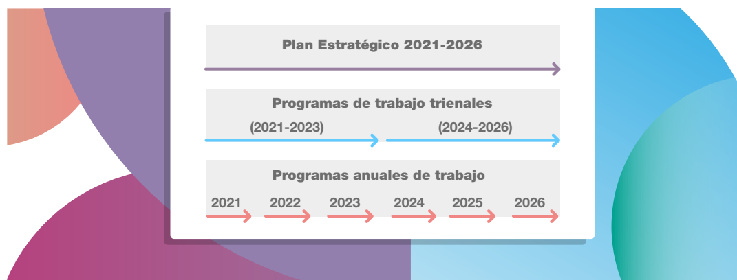
Gráfico 1. Ciclo de planificación estratégica en el ámbito del INDEC

Así, la implementación de los objetivos estratégicos en proyectos, actividades y tareas se realiza mediante la ejecución de los diferentes programas de trabajo. Una vez que el INDEC define, promueve y monitorea sus perspectivas estratégicas, estas se traducen en objetivos, proyectos y actividades a nivel de cada una de las áreas que componen la estructura organizativa vigente 4 , de modo tal que puedan cumplir con sus respectivas misiones, funciones y responsabilidades primarias.