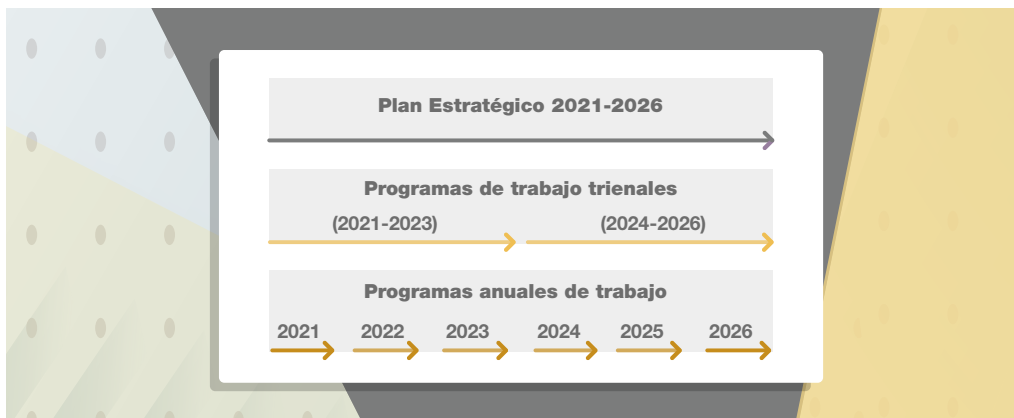
Gráfico 1. Ciclo de planificación estratégica en el ámbito del INDEC