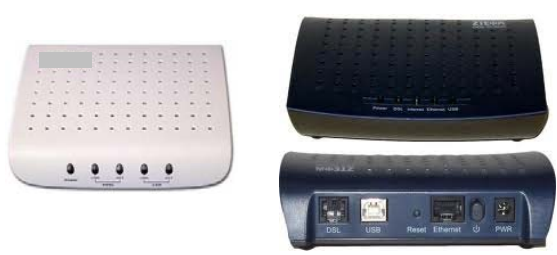
Figura 4. Modelos de modem habitualmente utilizados para acceso a Internet por conexión telefónica ADSL.

“...Línea telefónica Dedicada” puntualiza la conexión a través de una línea telefónica fija, que tiene como particularidad que puede hablar por teléfono mientras se utiliza la conexión a Internet. Se denomina conexión ADSL. Nótese la diferencia entonces entre la primera alternativa de respuesta (Dial-up) y este caso (ADSL): en la primera en el hogar no pueden utilizar el teléfono si se conectan a Internet y en la segunda si lo pueden utilizar.