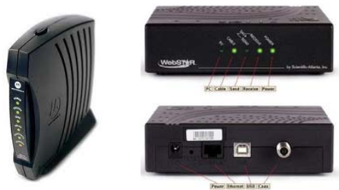
Figura 1. Modelos de modem habitualmente utilizados para acceso a Internet por conexión Cablemodem.

“... Línea telefónica” se refiere a la conexión en el hogar a través de una línea telefónica fija, que tiene como particularidad que mientras se utiliza la conexión a Internet no es posible hablar por teléfono. Se denomina conexión Dial-up.