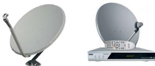
Figura 1. Modelo de antena y decodificador habitualmente utilizado para acceso a TV satelital en el hogar.

“...Satelital” refiere a la señal que se recibe en la vivienda a través de una antena parabólica. Esta antena suele estar colocada en el techo o en una pared exterior de la vivienda. Ver figura 1.