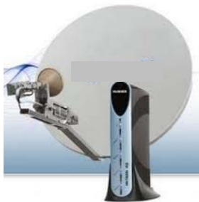
Figura 5. Modelos de dispositivos habitualmente utilizados para conexión satelital.

través de cable, distinta del cablemodem).