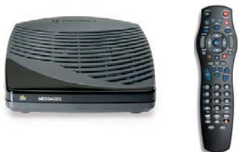
Figura 4. Modelo de decodificador y control remoto habitualmente utilizados para acceso a TV digital por cable en el hogar.

“ ... Antena” refiere a la señal que se recibe por aire a través de una antena. Excluye la TV digital y satelital. Esta antena suele estar colocada en el techo exterior de la vivienda. Ver figura 4.