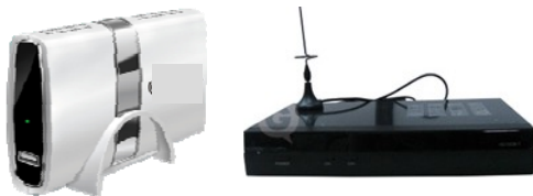
Figura 2. Modelos de antena y decodificador habitualmente utilizados para acceso a TV digital terrestre en el hogar.

“...Por Cable” Se trata de la señal de TV que llega a la vivienda a través de un cable (cable coaxial), servicio frecuentemente llamado “cable”. Incluye a la TV Digital paga, es decir a la que llega al hogar pagando un abono periódico (generalmente mensual). En algunos casos puede requerir la utilización de un decodificador (Ver figura 4) en caso de que la señal sea digital. Caso contrario, el cable se conecta directamente al televisor (Ver figura 3).