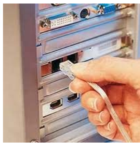
Figura 2. Modelo de conexión habitualmente utilizado para acceso a Internet por línea telefónica Dial-up.