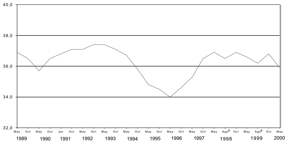
Gráfico 3.- Evolución tasa de desocupación Total aglomerados. 1989-2000