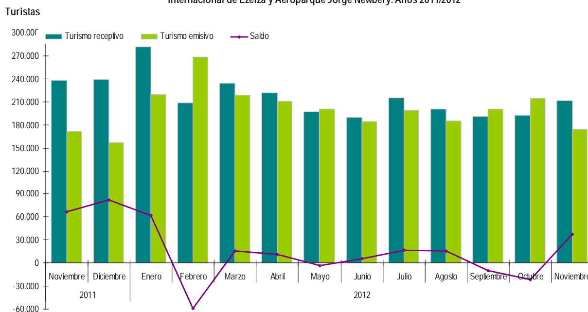
Gráfico 1. Turistas internacionales por condición de receptivo y emisor y saldo turístico. Aeropuerto Internacional de Ezeiza y Aeroparque Jorge Newbery. Años 2011/2012

Nota: los totales por suma de todos los cuadros y gráficos pueden no coincidir por redondeo en las cifras parciales.