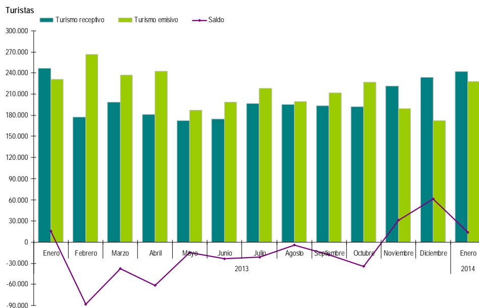
Gráfico 1. Turistas internacionales por condición de receptivo y emisor y saldo turístico. Aeropuerto Internacional de Ezeiza y Aeroparque Jorge Newbery. Años 2013-2014

Nota: los totales por suma de todos los cuadros y gráficos pueden no coincidir por redondeo en las cifras parciales.