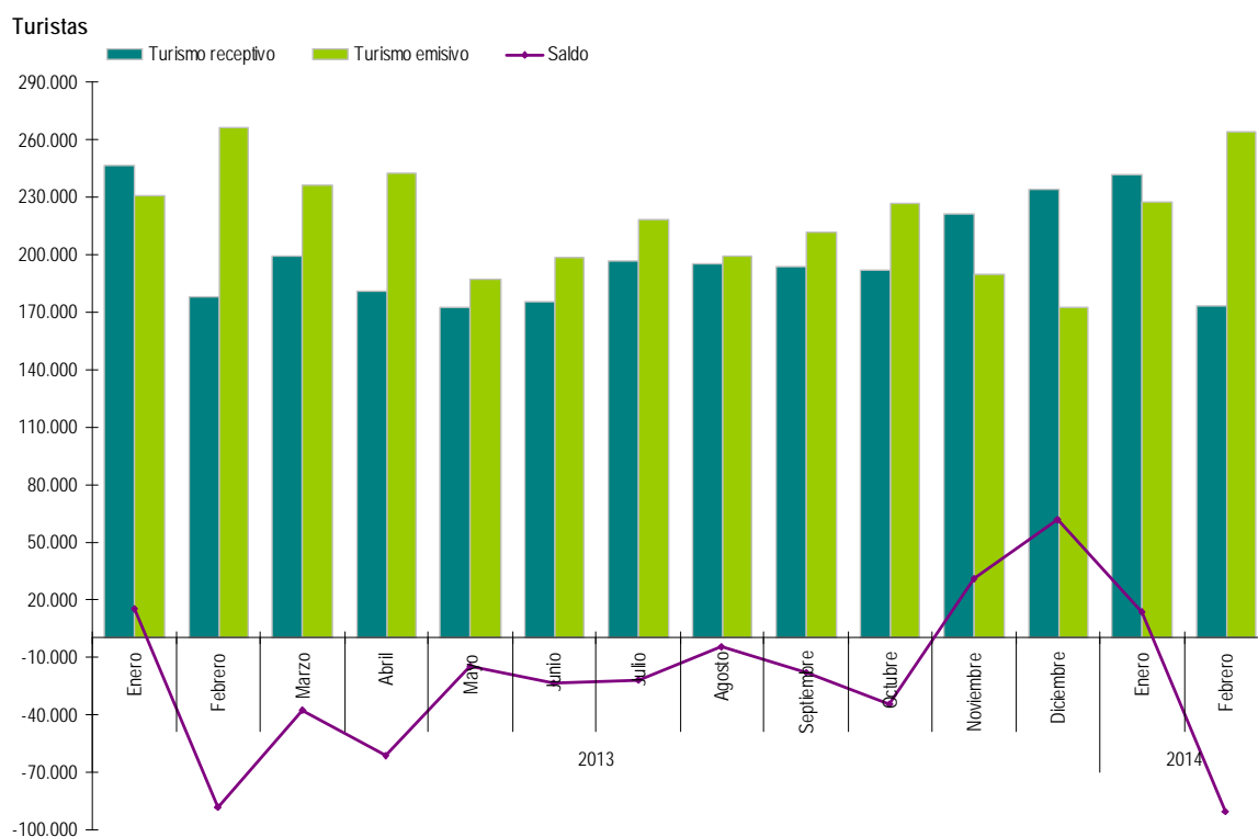
Gráfico 1. Turistas internacionales por condición de receptivo y emisor y saldo turístico. Aeropuerto Internacional de Ezeiza y Aeroparque Jorge Newbery. Años 2013-2014

Nota: los totales por suma de todos los cuadros y gráficos pueden no coincidir por redondeo en las cifras parciales.