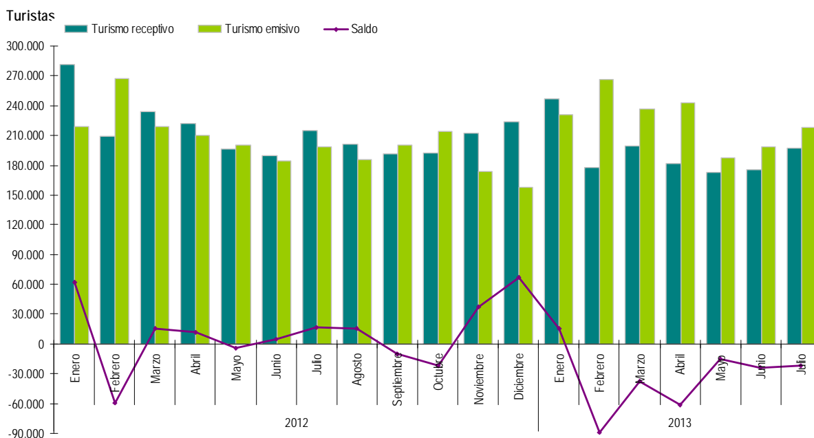
Gráfico 1. Turistas internacionales por condición de receptivo y emisoro y saldo turístico. Aeropuerto Internacional de Ezeiza y Aeroparque Jorge Newbery. Años 2012-2013

Nota: los totales por suma de todos los cuadros y gráficos pueden no coincidir por redondeo en las cifras parciales.