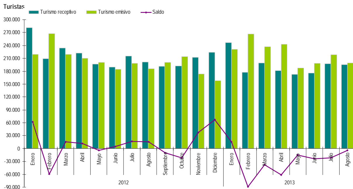
Gráfico 1. Turistas internacionales por condición de receptivo y emisor y saldo turístico. Aeropuerto Internacional de Ezeiza y Aeroparque Jorge Newbery. Años 2012-2013

Nota: los totales por suma de todos los cuadros y gráficos pueden no coincidir por redondeo en las cifras parciales.